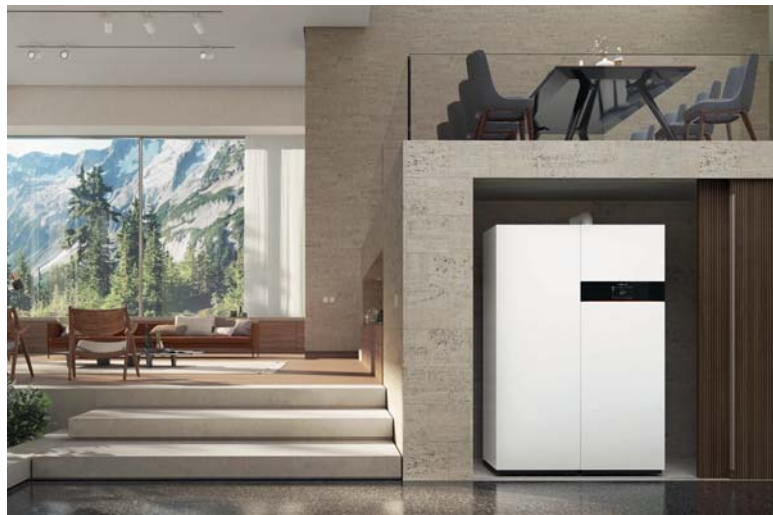
Brennstoffzellen-Heizgerät mit Spitzenlastkessel und Warmwasserspeicher

Mit der Brennstoffzelle durch eigene Stromerzeugung von steigenden Energiekosten unabhängig werden