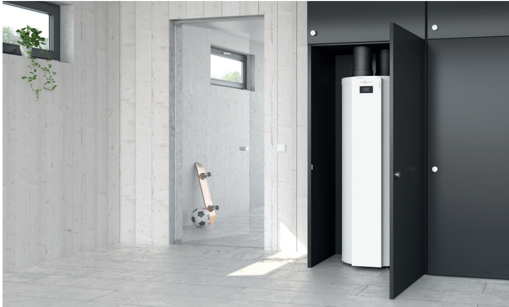
Warmwasser-Wärmepumpe Vitocal 060-A

Die Warmwasser-Wärmepumpe Vitocal 060-A garantiert sowohl im Neubau als auch bei der Modernisierung eine effiziente Warmwasserbereitung.