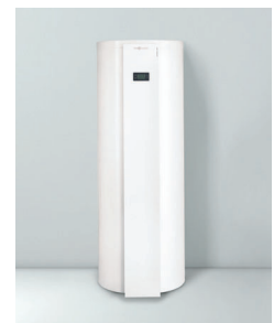
Vitocal 060-A (Typ T0E-ze und Typ T0S-ze)