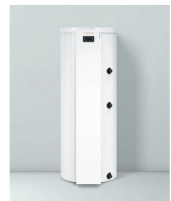
Vitocal 060-A (Typ T0E)