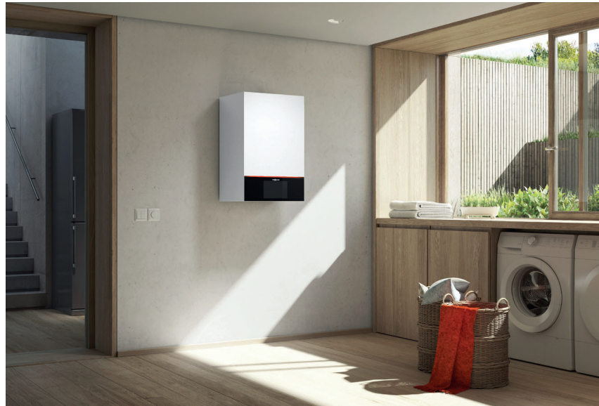
Vitodens 300-W mit attraktivem Design in der Farbe Vitopearlwhite

Mehr Effizienz, niedrige Emissionen, einfache Bedienung. Zukunftssicher, langlebig und digital: Vitodens 300-W.