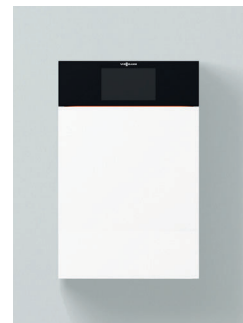
Komfortable Bedienung auf Augenhöhe durch nach oben versetzbares Display

Die Geräte sind für Erd- und Flüssiggas nach EN 15502 geprüft und zugelassen. Abweichende Nenn-Wärmeleistung bei Betrieb mit Flüssiggas, siehe Planungsanleitung. Warmwasser-Ausgangsleistung bei Trinkwassererwärmung von 10 auf 45 °C.